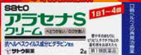
アラセナS クリーム(2g)