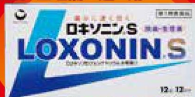
ロキソニンS 12回分(12錠)