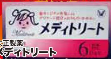
大正製薬 メディトリート 膣坐剤 6日間用(6個入)