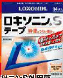
ロキソニンS外用薬