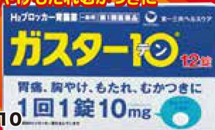
第一三共 ヘルスケア ガスター10