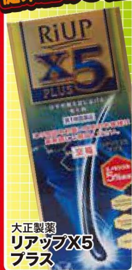
大正製薬 リアップX5 プラス